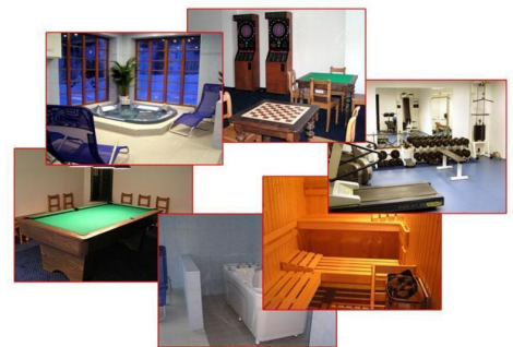
WELNESSCENTRUM PRKENNY DUL

Bouwjaar: 2008 Perceeloppervlakte: 1500 m 2 Aantal kamers: 5 Vraagprijs: € 350,- per week excl